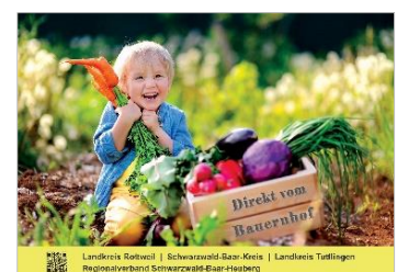
Aktuelle Broschüre 2020