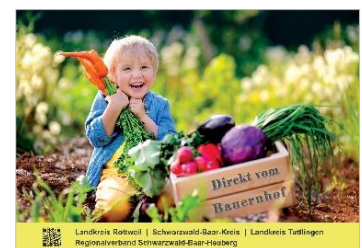
Aktuelle Broschüre 2020